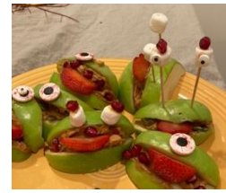
圖 3 萬聖節創意點心

與角色扮演的謀殺案遊戲。每個角色都有利益關係，贏得遊戲的關鍵是在不洩漏秘密的情況下。我喜歡美國人對食物的創意，如圖 3 他們用綠蘋果和其他材料製作出可愛