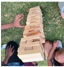
圖 2 Jenga 遊戲

猶記剛開學時，TAMU 辦給新生很多活動，我參加了許多活動，如圖 1，我們參加的活動有很多學校