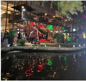
圖 4 River Walk 河景

而我在德州深刻體驗到美國的特殊文化，尤其是萬聖節、感恩節和聖誕節。在萬聖節，我穿上 FBI 探員裝扮，參