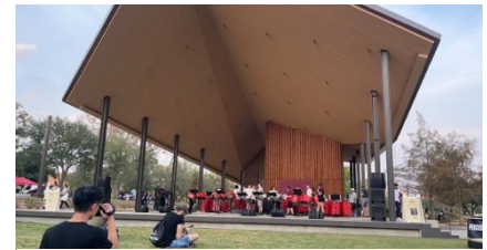
圖 1 新生活動現場

朋友說這個遊戲很盛行，特別是大型的積木特別受到他們的喜愛。我也藉由這次的活動更加了解學校的單位，例如寫作中心提供寫作顧問，解答英文寫作問題，也舉辦課程和工作坊、教學卓越中心(CTE)則協助國際學生提升英文能力，特別注重培養優秀的助教。